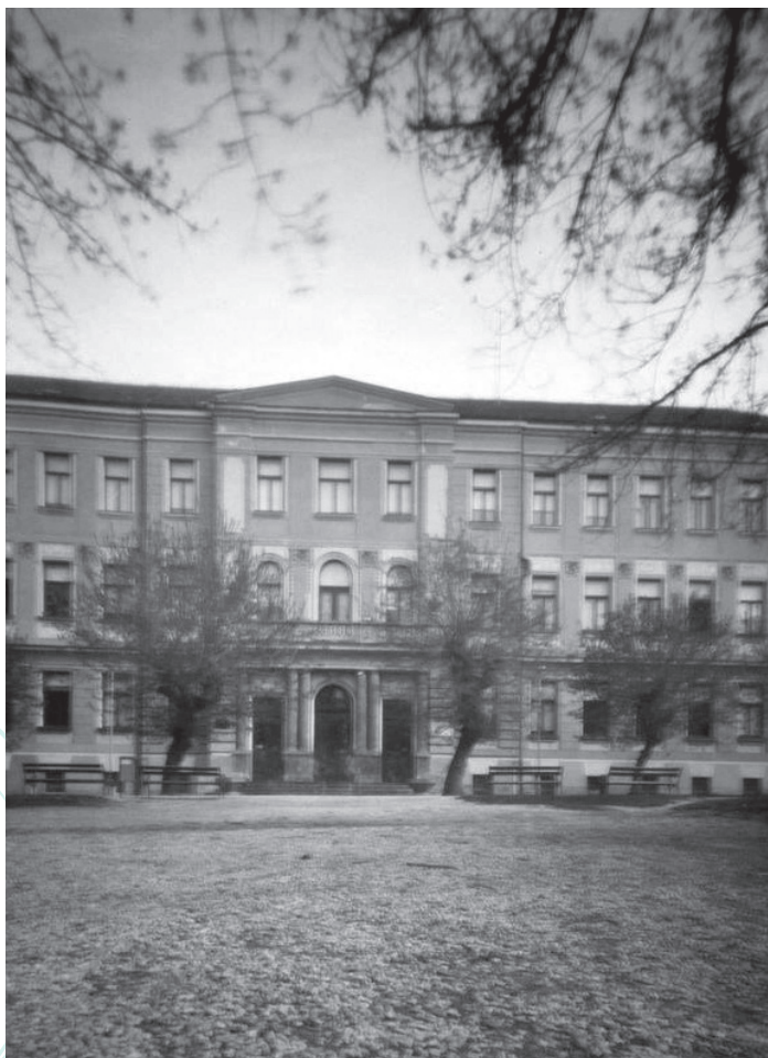
Škola koju volim, camera obscura